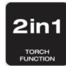
2 in 1-

Mehrfachwinkelverstellung mit 180°-Ratschenmechanismus und integriertem Aufhängehaken für eine präzise Lichtplatzierung