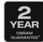
2 Jahre OSRAM-Garantie*

Von großen Arbeitsbereichen bis hin zu detaillierten Kontrollen – diese vielseitige Zwei-in-Eins-Leuchte passt sich jeder Aufgabe an