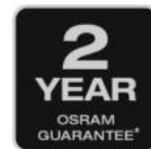
2 Jahre OSRAM-Garantie*

Von großen Arbeitsbereichen bis hin zu detaillierten Kontrollen – diese vielseitige Zwei-in-Eins-Leuchte passt sich jeder Aufgabe an