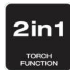
2 in 1-

Mehrfachwinkelverstellung mit 180°-Ratschenmechanismus und integriertem Aufhängehaken für eine präzise Lichtplatzierung